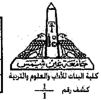
درجات التقدير العام