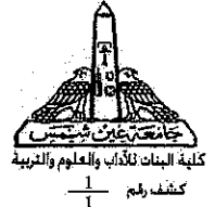
درجات التقدير للعام