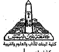
درجات التقدير العام