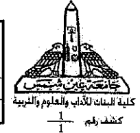
درجات التقدير العام